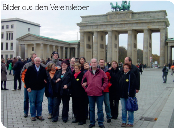
Gruppenausflug nach Berlin