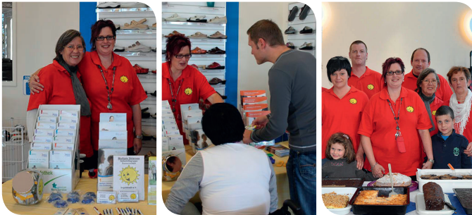
4. Ingolstädter MS -Tag bei der Spörer Gesundheitsgruppe