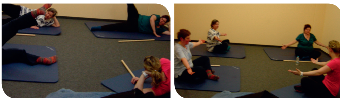
Sport-Therapie unter physiotherapeutischer Aufsicht

Mehr Informationen über Multiple Sklerose bzw. unseren Verein erfahren Sie unter: